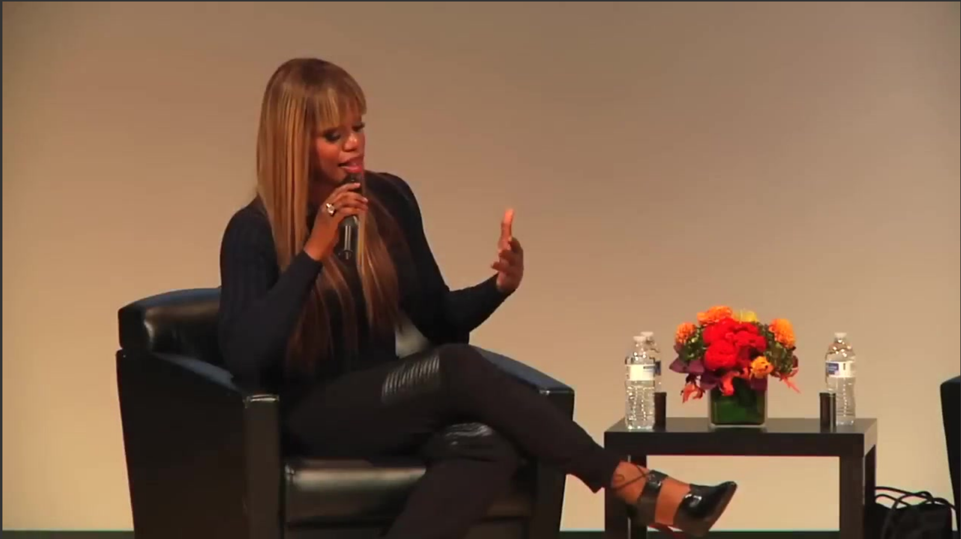
2014, A Public Dialogue Between bell hooks and Laverne Cox